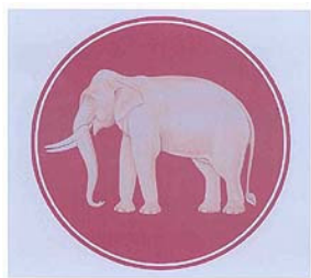
"ช้างไทย" Chang Thai (Elephant หรือ Elephas maximus )

สำหรับเครื่องหมายอื่นใดอันมีความหมายถึงรัฐหรือประเทศไทยนั้น หมายถึง รูปช้างไทย ดอกราชพฤกษ์ (คูณ) และ ศาลาไทย ซึ่งคณะรัฐมนตรีได้ประกาศกำหนดให้เป็นสัญลักษณ์ประจำชาติไทย เมื่อวันที่ 1 กุมภาพันธ์ 2548 และสำนักงานปลัดสำนักนายกรัฐมนตรี ทำเนียบรัฐบาลได้มีหนังสือที่ นร 0108/ว298 ลงวันที่ 20 มกราคม 2548 ถึงอธิบดีกรมทรัพย์สินทางปัญญา ขอความร่วมมือระงับการจดทะเบียนภาพสัญลักษณ์ประจำชาติไทยไว้แล้ว