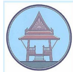
ศาลาไทย Sala Thai (Pavilion)

การที่จะถือว่าเป็นแถบสีของธงชาติไทยนั้น มีคำวินิจฉัยของคณะกรรมการกฤษฎีกา ดังนี้ คำวินิจฉัยของคณะกรรมการกฤษฎีกาที่ 423/2527 " มาตรา 5 (1) (5) แห่งพระราชบัญญัติธง พ.ศ.2522 ได้บัญญัติให้ธงชาติไทยมีแถบสี 5 แถบตลอดความยาวของผืนธง โดยตรงกลางเป็นแถบสีน้ำเงินแก่กว้าง 2 ส่วน ต่อจากแถบสีน้ำเงินแก่ออกไปทั้งสองข้างเป็นแถบสีขาวกว้างข้างละ 1 ส่วน ต่อจากแถบสีขาวออกไปทั้งสองข้างเป็นแถบสีแดงกว้างข้างละ 1 ส่วน ฉะนั้น แถบสีที่นำไปประดับหรือตกแต่งสินค้าเครื่องแต่งกาย อันจะอยู่ภายใต้บังคับบทบัญญัติแห่งกฎหมาย จึงย่อมหมายความว่าแถบสีธงชาติไทยที่มีลักษณะตามที่บัญญัติไว้ในพระราชบัญญัติธง พ.ศ.2522 คือมีแถบสี 5 แถบ ตลอดความยาวของผืนธง ตรงกลางเป็นแถบสีน้ำเงินแก่กว้าง 2 ส่วน ต่อจากแถบสีน้ำเงินแก่ออกไปทั้งสองข้างเป็นแถบสีขาวกว้างข้างละ 1 ส่วน หากมีลักษณะแตกต่างไปจากที่บัญญัติไว้ดังกล่าวก็ไม่อาจถือเป็นแถบสีธงชาติไทยตามกฎหมาย "