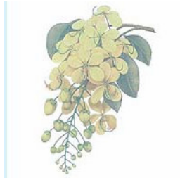
ดอกราชพฤกษ์ Ratchaphruek ( Cassia fistula Linn.)